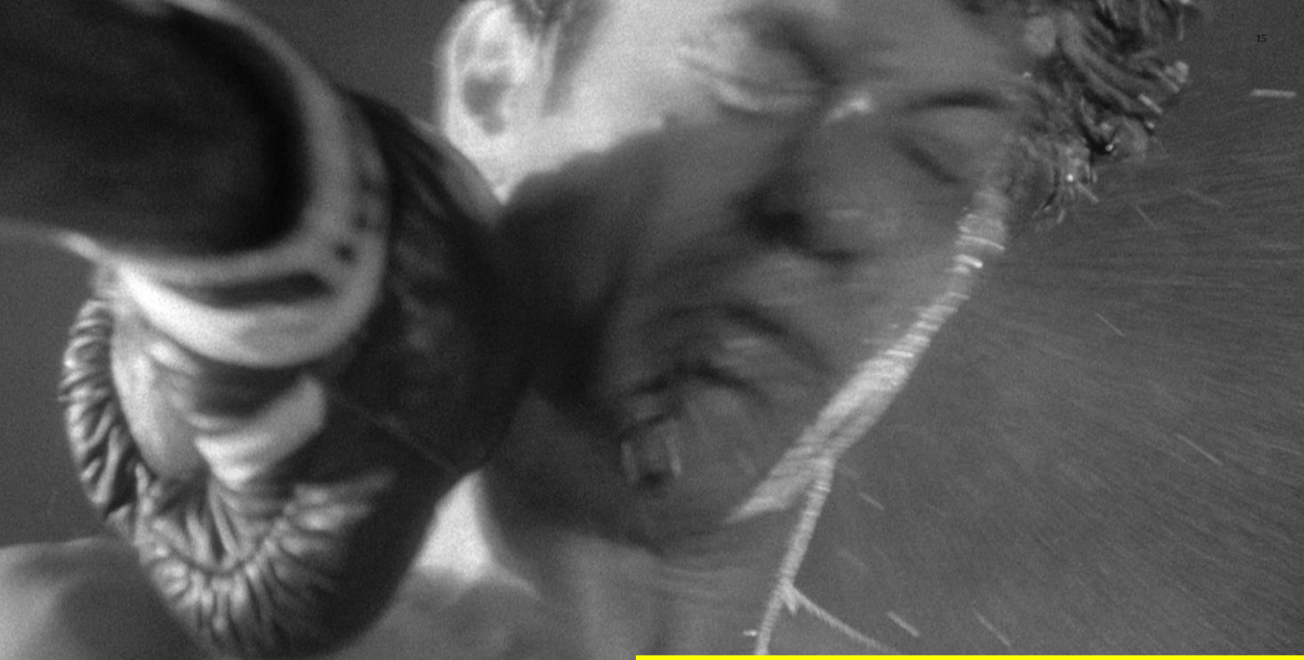
Imagem-ação = O corpo em ação