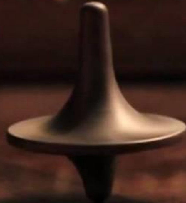
Imagem-tempo = Uma imagem que carrega tempo dentro de si, que toca a memória.