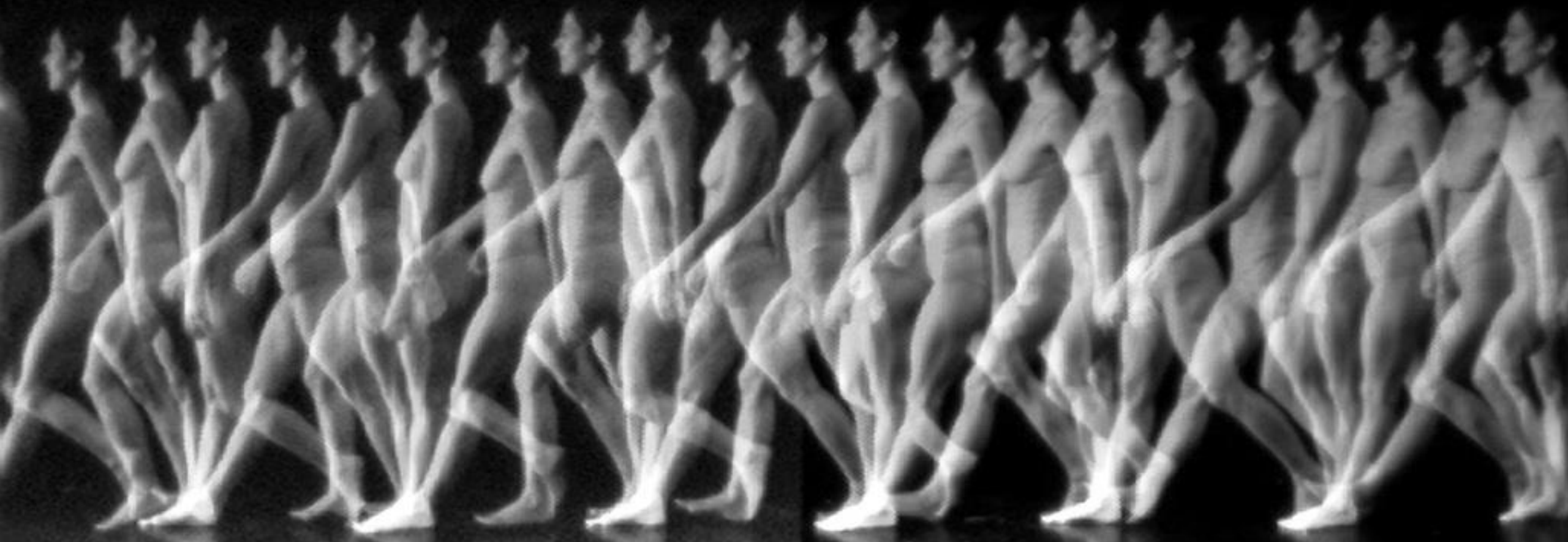
Imagem-movimento = Revela o movimento no mundo